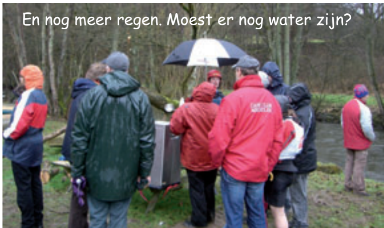
En nog meer regen. Moest er nog water zijn?

Water was er gevraagd en water hebben we gekregen, alleen een dag te laat. Een weekend wat op zaterdag veelbelovend begon met een streepje zon, veranderde zondag in een hevig regenspektakel dat er voor zorgde dat iedereen door nat was. Na nog een keer voor varen was iedereen wakker en ontdaan van de eventuele katers van de avond voordien en kon de strijd beginnen.