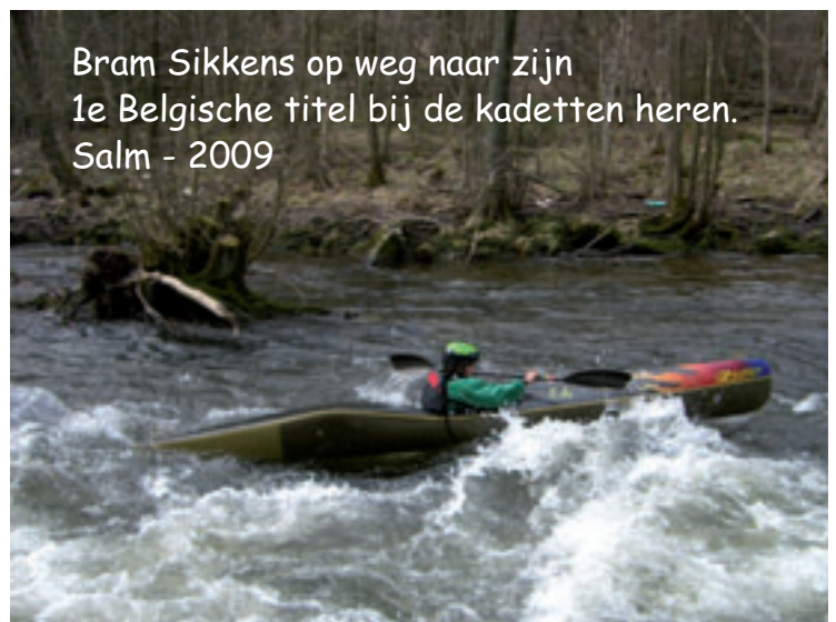
Bram Sikkens op weg naar zijn 1e Belgische titel bij de kadetten heren. Salm - 2009

Een geslaagd BK op een prachtige rivier met een goede organisatie door LKCA. Bedankt!!!