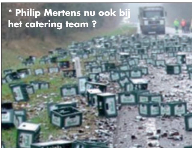
* Philip Mertens nu ook bij het catering team ?