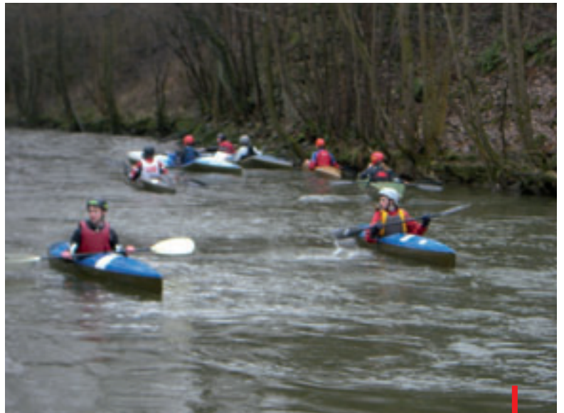
De Lomme, welke kant op???

Regen op de Lomme? Dat kan toch niet, de organisaties van KCCM kennen meestal schitterend weer!