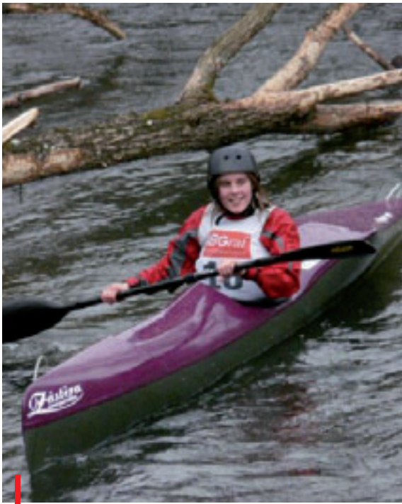
Ja Inge, kabouters bestaan nog.